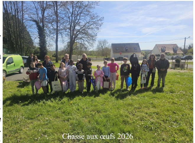
Chasse aux œufs 2026

Notez la date dans vos agendas, des bulletins d'inscription pour le repas vous seront remis dans votre boîte aux lettres pour vous permettre de passer une journée tous ensemble.